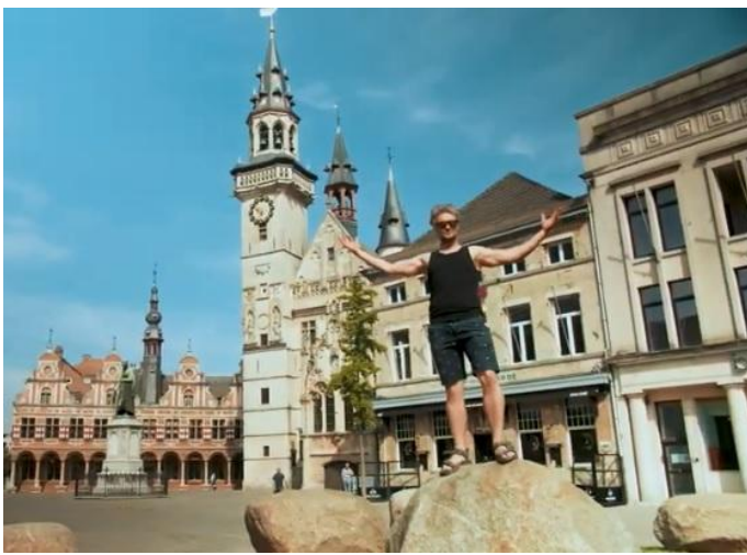
Wie moet er naar New York gaan als het Denderland vlakbij ligt?