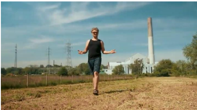
Waarom zou je naar Manchester of Birmingham gaan als er hier vlakbij ook zo'n industriële parel ligt?