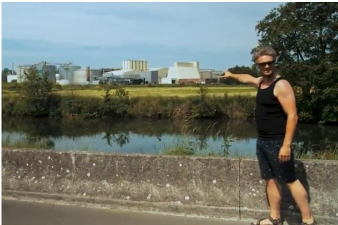
Waarom naar zee gaan als ge ook in de Denderstreek de zilte lucht van ontbindende kadavers kunt opsnuiven?