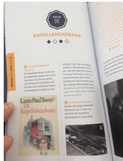
Uiteraard wordt in de gids ook de Kapellekensbaan bezocht!

In Aalst is de gids beschikbaar in 't Gasthuys – Stedelijk Museum (Oude Vismarkt) en het Toeristisch infokantoor Aalst aan de Hopmarkt 51.