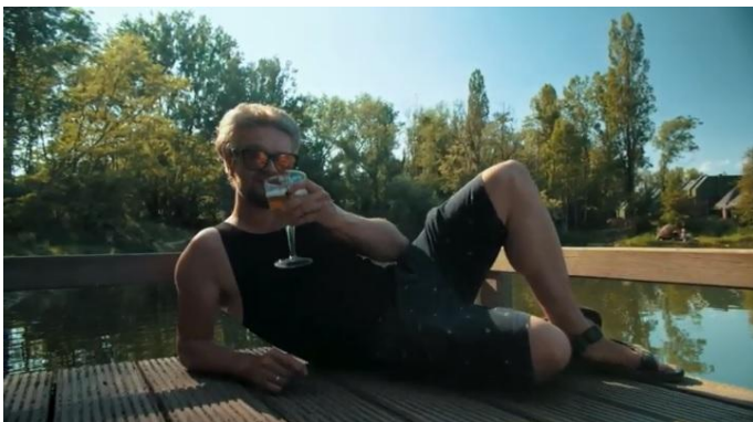
Salud! En tot in Denderland hè!