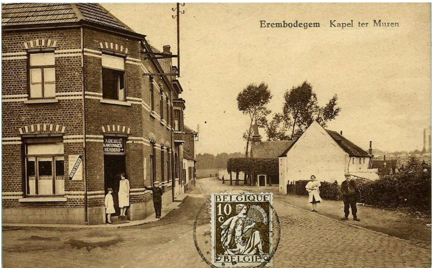
Historische ansichtkaart van de Kapellekensbaan