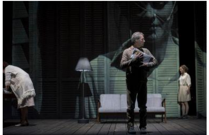
Toneelbeeld bij opera Menuet

https://www.theatrenational.be/nl/activities/53-menuet#presentation